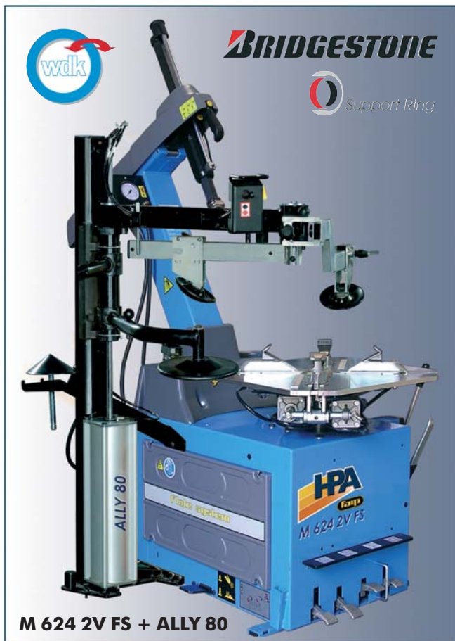
M 624 2V FS + ALLY 80

Grande capacità di bloccaggio e prestazioni superiori. Wide clamping range and top performances. Gran capacidad de bloqueo y altas prestaciones.